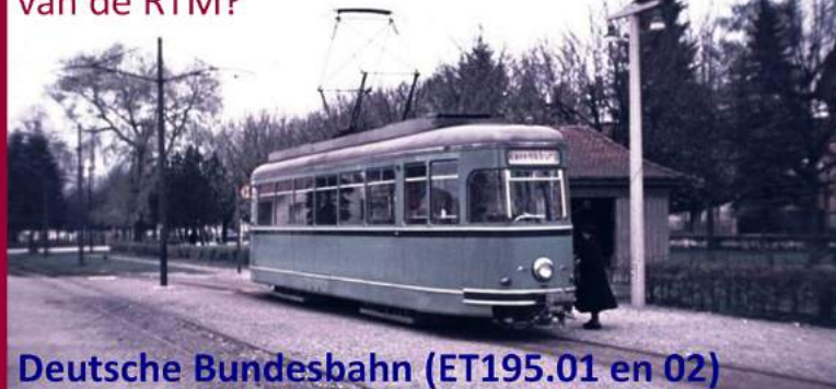
Deutsche Bundesbahn (ET195.01 en 02)

Wie was de eerste eigenaar van de Großraum-trams uit het 'Sperwer'-tramstel van de RTM?