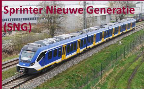
Sprinter Nieuwe Generatie (SNG)

Het Spaanse CAF levert NS 'Civitas'-treinstellen. Hoe heten zij bij NS?